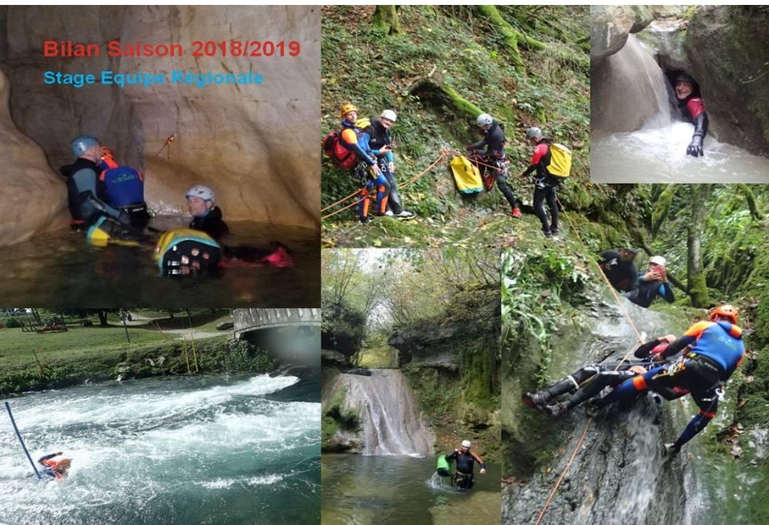
Bilan Saison 2018/2019 Stage Equipe Régionale